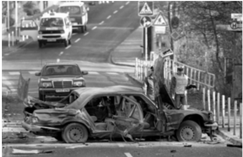
Das Auto von Alfred Herrhausen nach dem Attentat