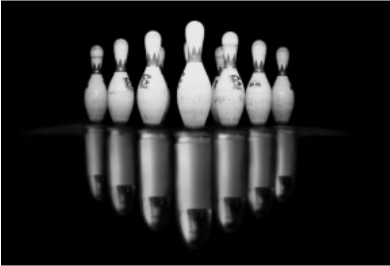
Das Plakatmotiv zum Film als Metapher

ruhige Handkamera korrespondiert auf der Montageebene mit assoziativ eingesetzten, kurzen Bildfolgen aus unterschiedlichen Bild- und Tondokumenten, beispielsweise historischen Aufnahmen, TV-Sendungen oder Statements von Personen aus dem Zeitgeschehen.