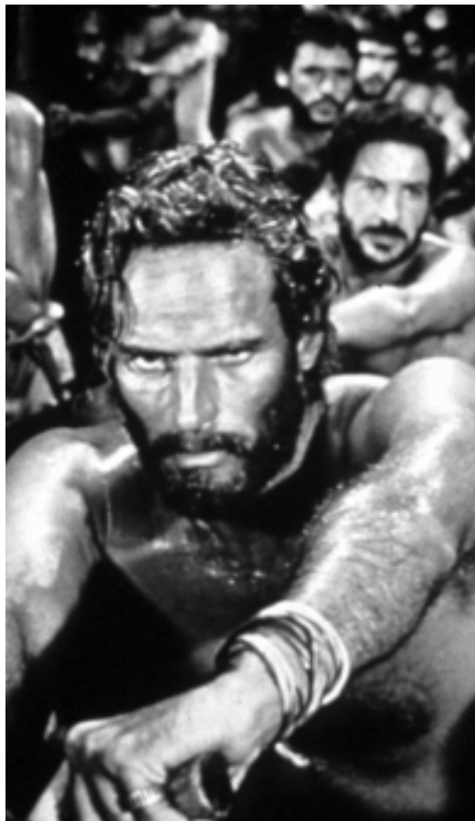
Charlton Heston 1959 in BEN HUR

1997 wurde er Vizepräsident der National Rifle Association (NRA) und war von Mitte 1998 bis April 2003 deren Präsident, um „das Ansehen der NRA zu verkaufen“. Während er sich nach der Ermordung von Martin Luther King und John F. Kennedy in den 1960ern noch für eine Waffenkontrolle aussprach, setzt er sich heute für das uneingeschränkte Recht auf Waffenbesitz ein.