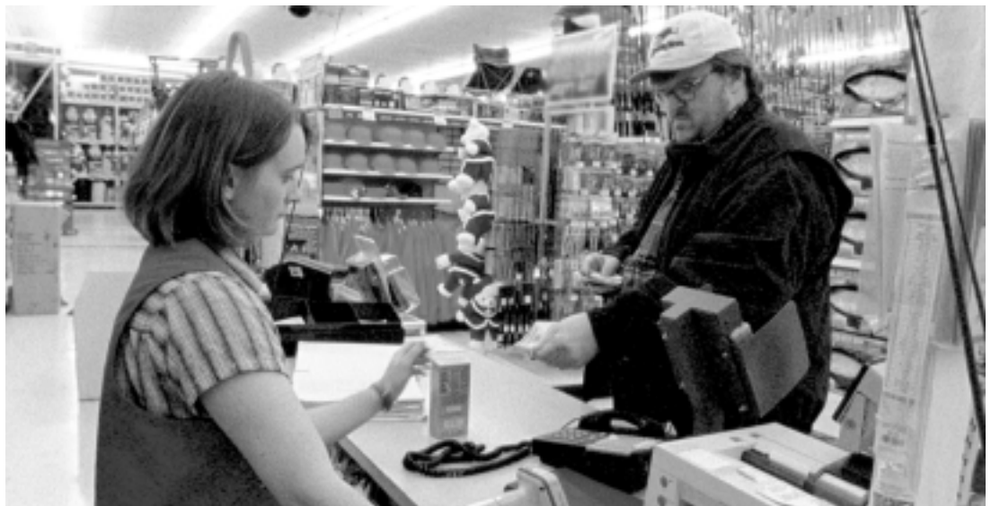
Unproblematischer Munitionskauf bei K-Mart