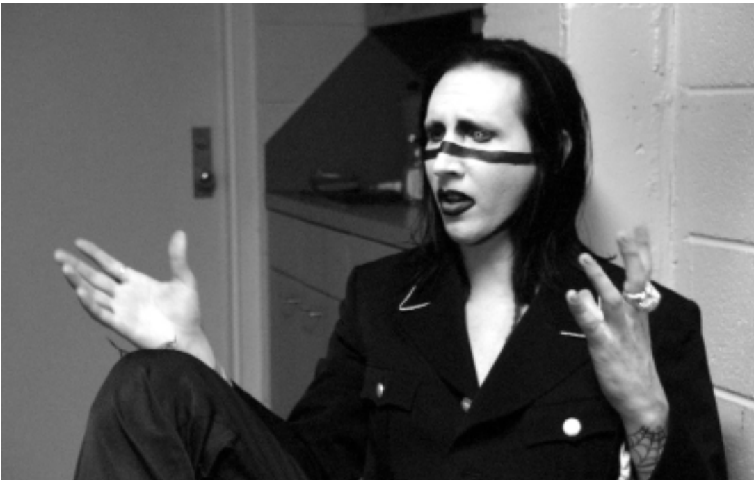
Leadsänger Marilyn Manson im Interview mit Michael Moore

Zur Emotionalisierung und Parteinahme des Zuschauers setzt Moore gezielt Musik ein, so wie es in Spielfilmen geschieht – mit einem Unterschied: Im Spielfilm dient sie häufig der Untermalung von Gefühlen und soll nicht unbedingt bewusst wahrgenommen werden. In BOWLING FOR COLUMBINE muss man genau zuhören und die Songtexte verstehen, um den ironisch-sarkastischen Kommentar zu den Informationen auf der Bildebene zu dechiffrieren. Wenn beispielsweise die Michigan-Miliz ihre Trainingscamps abhält, hört man in der betreffenden Sequenz eine kontrastierende, lustige Melodie. Besonders deutlich wird dieses Stilprinzip, wenn Moore die Sequenz über die Kriegszüge der USA seit 1953 mit dem Evergreen „What a wonderful world“ unterlegt, der in einer Cover-Version auch den Abspann des Films begleitet.