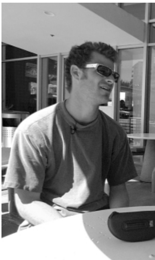
Matt Stone, einer der Erfinder von „South Park“

konnte seiner Wut allerdings mit einem Cartoon Luft machen, den Moore in seinem Film nutzt. Nach dem Attentat wurde an vielen amerikanischen Schulen die „Null-Toleranz-Politik“ ausgeweitet und Schüler wurden sogar bei geringsten Vergehen oder Auffälligkeiten oft der Schule verwiesen. Manche Schulen glichen Gefängnissen mit strengen Kontrollen, deren „Insassen“ als „tickende Zeitbomben“ gesehen wurden. Moore schließt den ersten Teil seiner Untersuchung mit dem ironisch gebrochenen Kommentar: „Unsere Kinder waren wirklich zum Fürchten, sie hatten sich in kleine Monster verwandelt.“