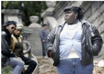
Gabourey Sidibe als Claireece "Precious" Jones

Im New Yorker Stadtteil Harlem des Jahres 1987 ist Selbstbewusstsein dünn gesät. Doch kaum jemanden hat das Schicksal so hart getroffen wie Claireece Jones, genannt "Precious". Nichts an ihrem Leben erscheint "wertvoll". Das schwarze, schwer übergewichtige Mädchen ist mit seinen 16 Jahren schon durch jede Hölle gegangen. In der Schule gehänselt, von der Mutter misshandelt und vom Vater seit der Kindheit regelmäßig vergewaltigt, erwartet sie von diesem ihr zweites Kind. Die erste gemeinsame Tochter hat das Down Syndrom. Den Blick meist zu Boden gerichtet, möchte Precious sich am liebsten unsichtbar machen. Ihr Gang ist so schleppend wie ihr Sprechen. Sich auszudrücken fällt ihr schwer. Sie ist Analphabetin, hat im Leben wenig gelernt außer dem Gefühl der eigenen Wertlosigkeit. Tatsächlich klingt ihr Kosename wie Hohn.