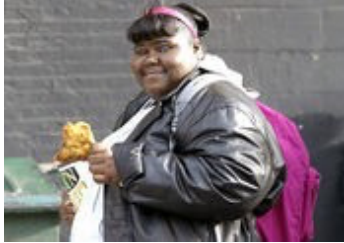
Precious - Das Leben ist kostbar

Selbstbewusstseins und damit verbunden die endgültige Ablösung von der Mutter.