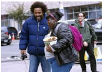
Regisseur Lee Daniels und Hauptdarstellerin bei den Dreharbeiten

Der Begriff "Black Cinema" ist somit gleichermaßen kulturell wie ökonomisch besetzt. Das muss bedacht werden, will man Lee Daniels Film Precious – Das Leben ist kostbar (Precious, USA 2009) historisch einordnen. Auch er ist eine größtenteils "schwarze" Produktion: Regisseur Lee Daniels hat seinen Film co-produziert, die Romanvorlage stammt von der Autorin Sapphire, protegiert wurde er von TV-Star Oprah Winfrey, und in den Hauptrollen sind unter anderem die Komödiantin Mo'Nique, der Musiker Lenny Kravitz und die Entdeckung Gabourey Sidibe zu sehen. Precious erzählt die Geschichte eines missbrauchten Teenagers im Harlem der 1980er-