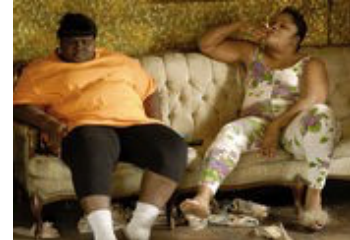
Precious und ihre Mutter

Regisseur Lee Daniels beschönigt nichts. Mit einem scharfen Blick für das afroamerikanische Trauma eines seit jeher überwiegend unterprivilegierten Lebens wagt er sich in Bereiche, die selbst Filmemacher/innen des Black Cinema gerne aussparen. Wenn Precious in den Spiegel blickt, sieht sie das Wunschbild einer schönen weißen Frau. Dieses grausame Zerrbild einer sozial erworbenen Selbstdiskriminierung ist nicht weniger real als die alltägliche Armut und Erniedrigung, die Precious durchlebt. Vor allem das Leben mit ihrer Mutter ist kaum zu ertragen. Mary herrscht in ihrer Wohnküche, wo sie die von Precious zubereiteten Mahlzeiten vor dem Fernseher verschlingt, wie eine gewalttätige Sklavenhalterin. Die Hasstiraden dieser Frau würden weit stärkere Gemüter zerbrechen. Was den Charakter der Mutter derart deformiert hat, lässt der Film offen.