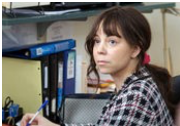
Mariah Carey als Sozialarbeiterin

Precious – Das Leben ist kostbar ist jedoch genau so wenig sentimentale Erlösungsfantasie wie niederdrückendes Sozialdrama. Der große Gewinn des Films liegt gerade darin, dass harter Realismus und gute Unterhaltung keinen Widerspruch bilden. Bunte Traumsequenzen – immer wieder imaginiert sich Precious als umjubelter Star – und ein empathischer Soul-Soundtrack dienen nicht nur als Stimmungsaufheller, sondern erschließen den Charakter der ungewöhnlichen Heldin. Auch begeht die auf authentische Milieuschilderung bedachte Kamera nicht den Fehler, das soziale Elend durch wackelige Bilder und dunkle Ausleuchtung unnötig zu verstärken. Am stärksten wiegen jedoch die überragenden Schauspielleistungen. Mit feinfühligem Engagement agieren hier Laien wie die Hauptdarstellerin Gabourey Sidibe neben TV-Prominenten und den Popstars Mariah Carey als Sozialarbeiterin sowie Lenny Kravitz als Krankenpfleger John.